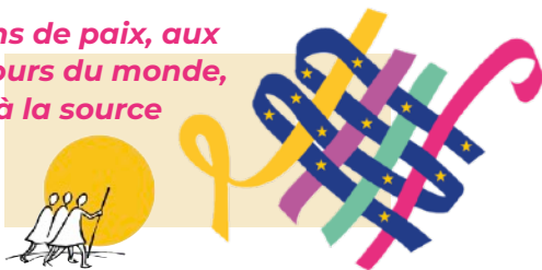
Table Ronde L'Europe et la Paix

Artisans de paix, aux carrefours du monde, venez à la source